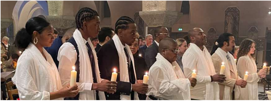
Les baptisés de la nuit pascale